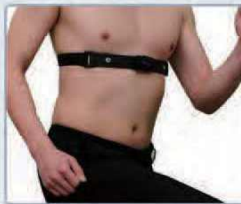
2. 가슴벨트 단독사용 방식 송신기(DSM100) + 가슴벨트(DSM100B)