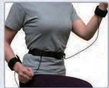
3. 가슴벨트 확장형 손목밴드 사용방식 송신기(DSM100) + 가슴벨트(DSM100B) + 손목밴드(DSM100C)

ECG 측정방식 / 최대 40명 동시 측정 / 통신가능거리 100m 이상 (지그비통신방식)