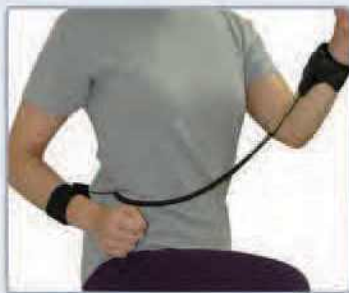
1. 손목밴드 단독사용 방식 송신기(DSM100) + 손목밴드(DSM100D)